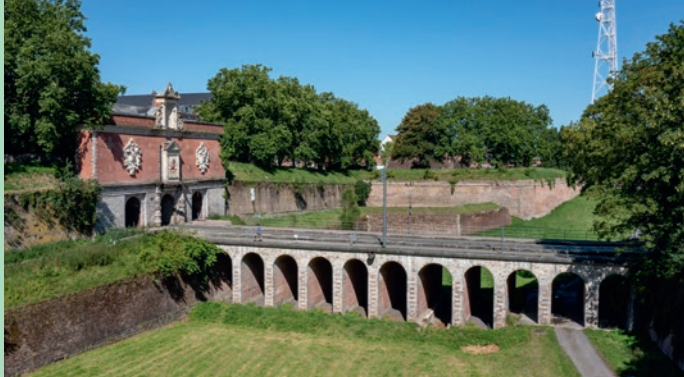
Porte de Roubaix