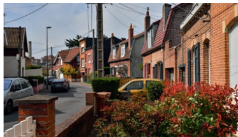
La cité des jardins de Lille-Sud