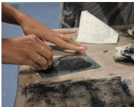
Atelier gravure © Aissata Maiga