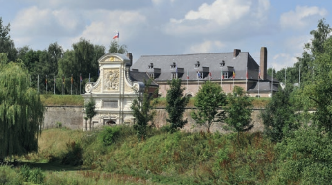
La citadelle de Lille