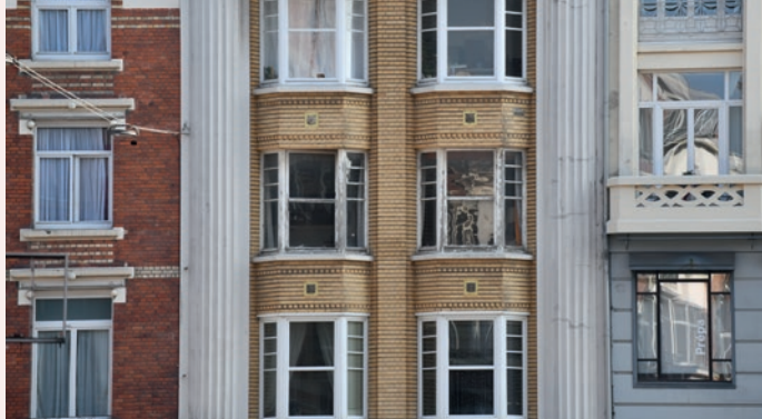
Immeuble Art déco rue du Molinel