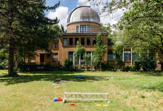
L'Observatoire de Lille