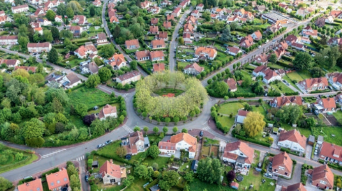
Vue aérienne de la cité-jardin de Lomme-Délivrance