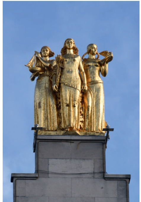
Les Trois Grâces

Retrouvez tous les détails de cette visite dans la rubrique « Incontournables » en page 4.