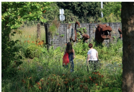
Le jardin des géants