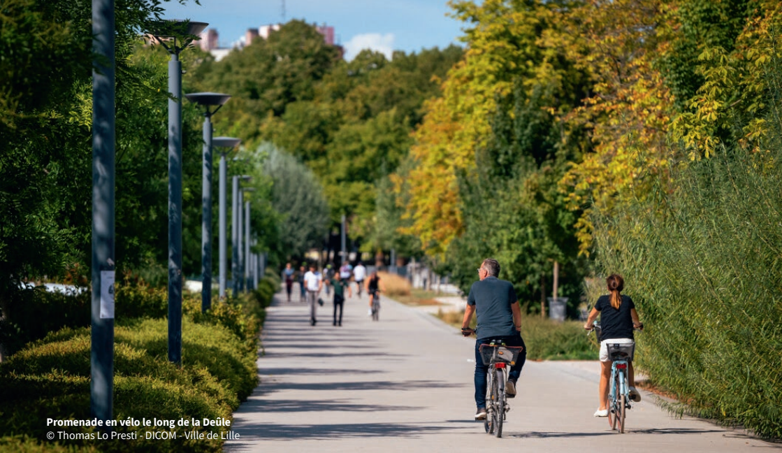
Promenade en vélo le long de la Deûle