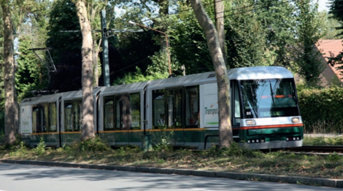
Visite en tramway